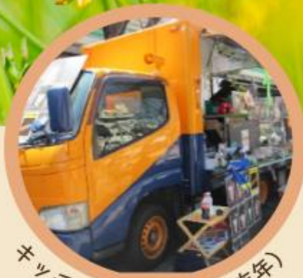
キッチンカーの様子 (昨年)