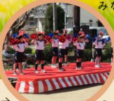
ステージ出演の様子 (昨年)

昨年につき2回目の開催！ 地域の団体や企業、学校などと協力して、 見附公園でイベントを開催します。 みなさん、どうぞお越しください！！