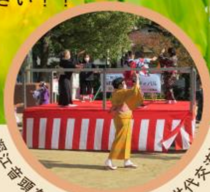
深江音頭を踊る様子 (昨年三世代交流)